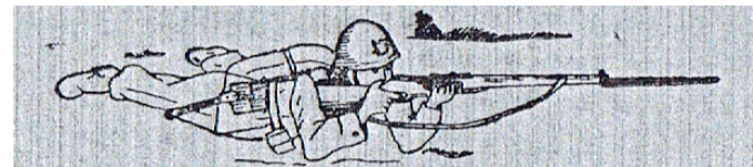
Złożenie do strzału w postawie „leżąc”