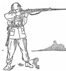
Złożenie do strzału w postawie „stojąc”

Towarzystwo Gimnastyczne „Sokół” w Sanoku ul. Mickiewicza 13 I p., 38-500 Sanok www.sokolsanok.pl